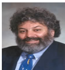
R. Edward FREEMAN

Professor, Darden School of Business (University of Virginia)